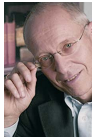
O Dr. med. Dahlke recomenda QUANTEC® ExpertScan

Para saber mais sobre n o s s o m ó d u l o psicossomático do software ExpertScan, recomendamos o artigo publicado na revista CoMed.