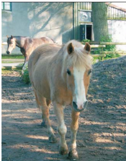
Figura 2: Desfrute de uma vida num estábulo aberto: Mona, ganhou um monte de qualidade de vida através da bio-comunicação instrumental.