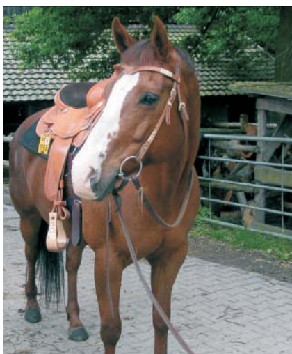
Figura 3: Por um longo tempo ninguém podia andar na Ronja e a medicina académica a considerou intratável. Atualmente, o proprietário pode montá-la.