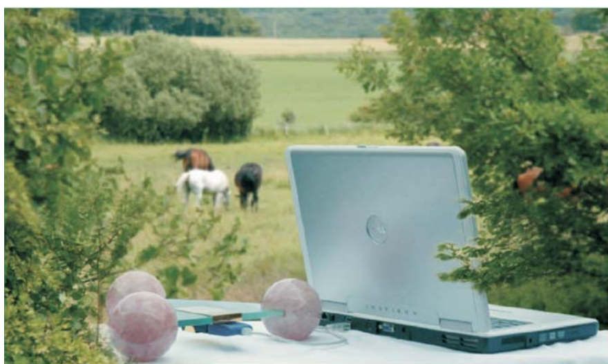
Figura 1: Bio-comunicação instrumental - uma combinação especial de natureza, medicina e tecnologia.

Como na medicina humana, na medicina veterinária também se vai perseguindo os princípios terapêuticos integrais. A base é o conhecimento de que uma convalescença global e ao longo prazo só é possível quando são conhecidos e podem-se eliminar as causas de uma doença ou dos problemas de saúde. No entanto, apesar de sofisticados recursos de diagnóstico muitas vezes é difícil responder à pergunta do “por que” e reconhecer onde estão as causas. Com a ajuda da bio-comunicação instrumental é possível receber, além das capacidades de diagnóstico conhecidas, informações importantes do paciente, que inclui o meio ambiente, as condições de vida e a carga que suporta o paciente, facilitando assim ao terapeuta a investigação sobre as causas.